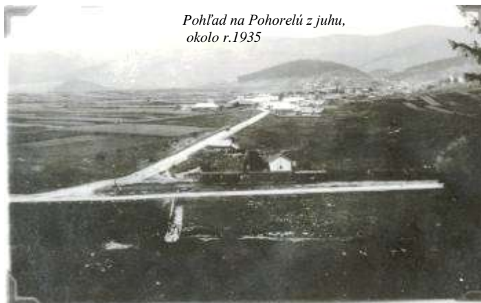
Pohľad na Pohoreľu z juhu, okolo r.1935