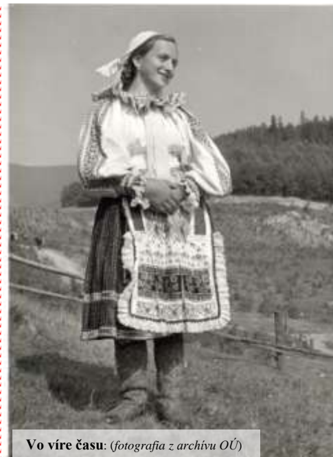
Vo víre času: