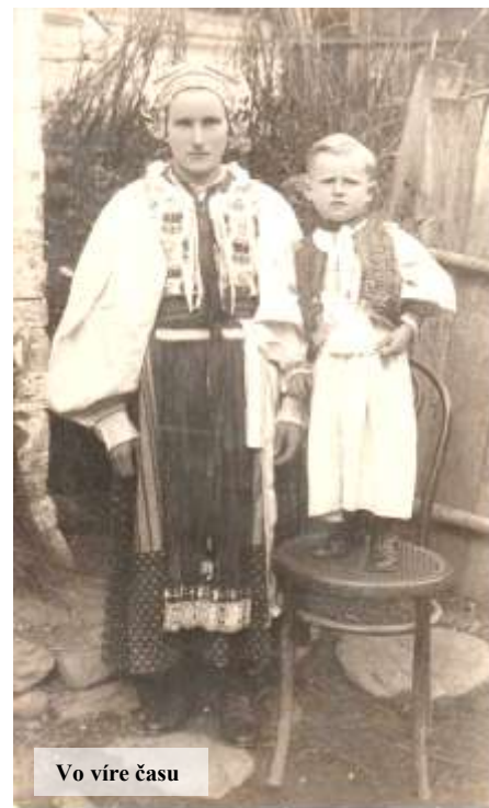
Vo víre času