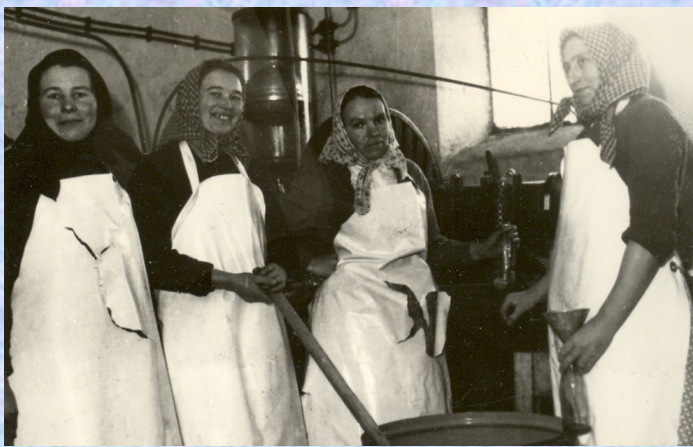
Výrobňa sódy a limonády v Pohorelej, r. 1959